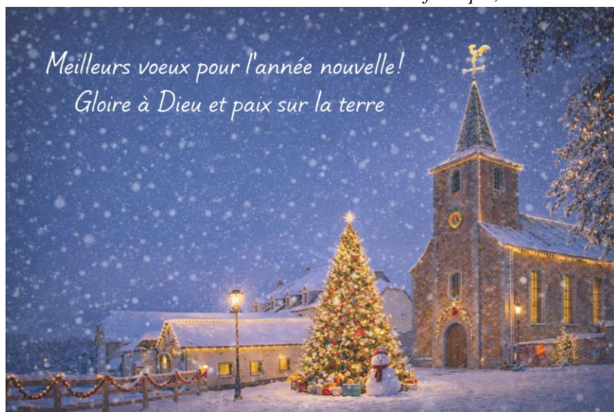
Photo de l'église d'Hemptinne (modifiée par IA) version « scène de Noël au village ! »

A très bientôt ! Pour la fabrique, Michel Selvais